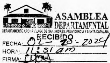
CHARLES CLIFFORD LIVINGSTON LIVINGSTON Gobernador (e)

Cra. 1ª. Av. Francisco Newball, Edificio CORAL PALACE PBX (8)5130801 Telefax 5123466 Página Web: www.sanandres.gov.co San Andrés Isla, Colombia