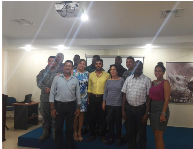
SESIÓN DESCENTRALIZADA BASE TC BENJAMIN MÉNDEZ.